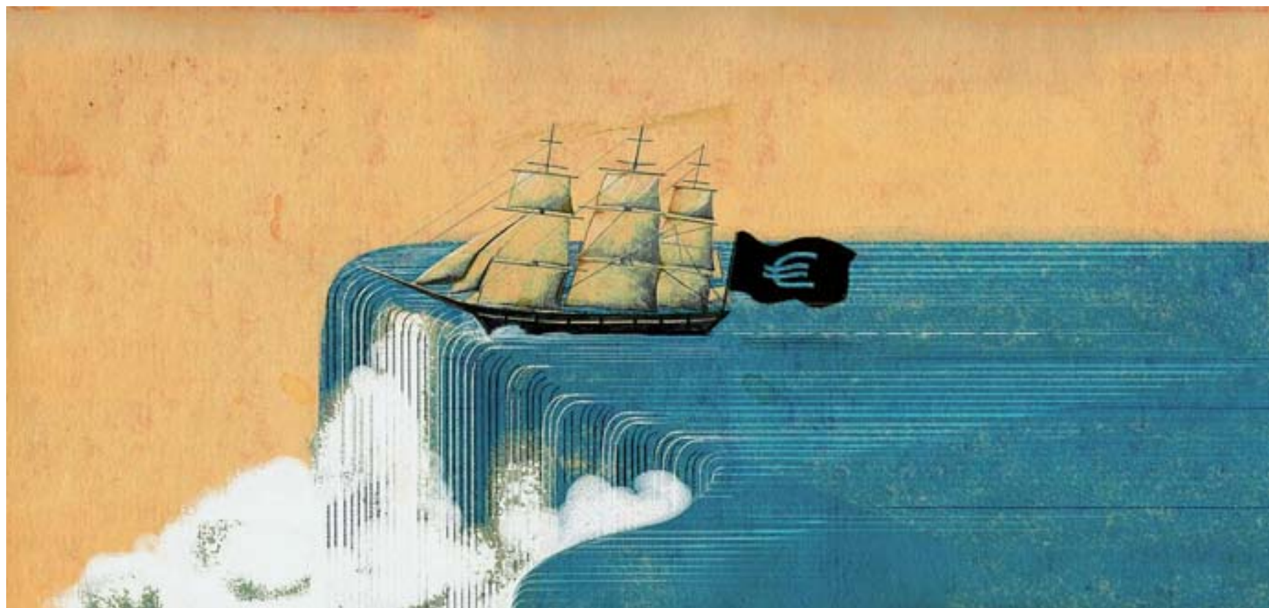
ILLUSTRAZIONE DI BEPPE GIACOBBE